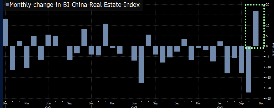
Ray of Hope Chinese developer stocks rally strongly on more financing support