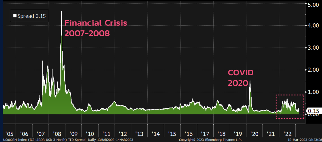
TED Spread Signals Stress Contained

อัตราเงินเฟ้อ Core CPI เดือน ก.พ. ยังทรงตัวระดับสูงโดยเฉพาะเงินเฟ้อจากที่อยู่อาศัย