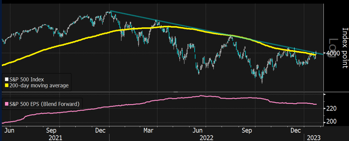
Source: Bloomberg SPX Index (S&P 500 INDEX) SPX Stuck 100,200 Daily 15JUN2021-27JAN2023 Copyright© 2023 Bloomberg Finance L.P. 24-Jan-2023 09:07:06